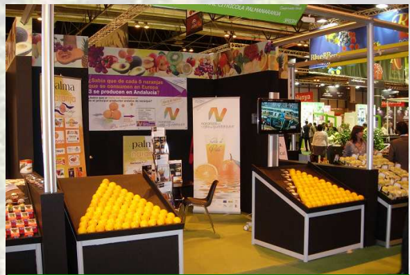
Vista del Stand en la Fruit Attraction

El Grupo de Desarrollo Rural ha marcado unos requisitos a cumplir por los comercializadores que deseen ampararse bajo esta Marca de Garantía, basado en un reglamento de uso, y una certificación expedida por la Asociación para la Promoción de las Naranjas del Valle del Guadalquivir, entidad encargada de velar por el cumplimiento de dichos requisitos.