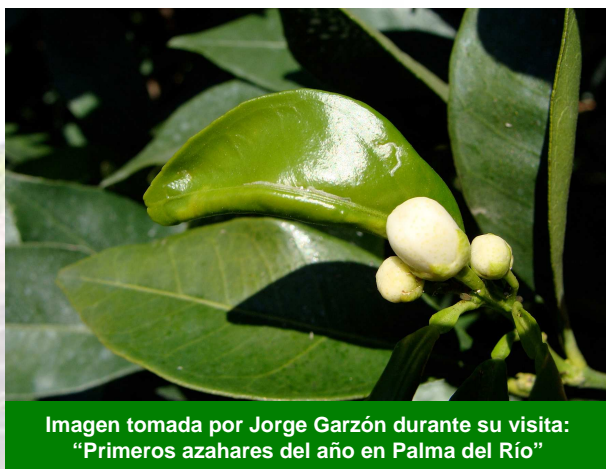
Imagen tomada por Jorge Garzón durante su visita: "Primeros azahares del año en Palma del Río"

se dio un paseo por los Pagos de Huertas y el río Genil en Palma del Río, y terminó su visita en las aceñas de Villa del Río .