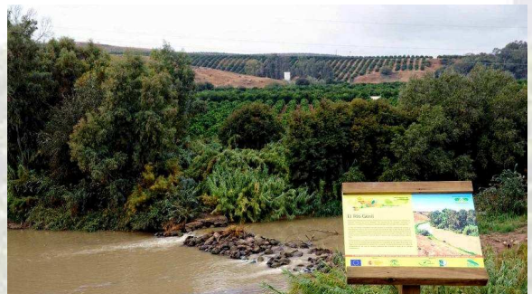
Río Genil en los Pagos de Huerta de Palma del Río

Durante el recorrido, los paneles informativos instalados acercan a los valores más significativos del patrimonio palmeño: el cultivo del naranjo, las casas de huertas, el patrimonio hidráulico, el río Genil, la naranja cadenera, etc.