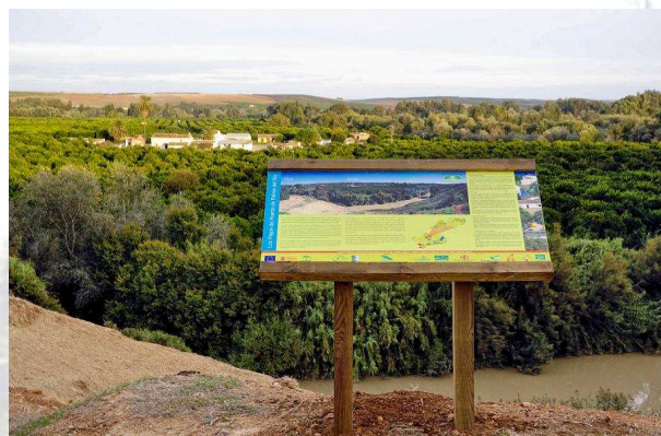
Río Genil en los Pagos de Huerta de Palma del Río

Esta actuación forma parte del proyecto de cooperación "Paisajes Agrarios Singulares Vinculados al Agua: Huertas y Regadíos Tradicionales", que entre 2007 y 2009 ha coordinado el Grupo de Desarrollo Rural del Medio Guadalquivir con el objetivo de proteger, conservar, recuperar y difundir los valores de este patrimonio cultural en peligro de desaparición o desvirtuación de su espíritu original que son las huertas y regadíos tradicionales de Andalucía.