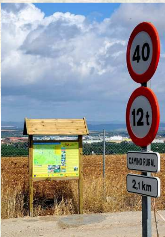
Cartel de inicio de la Ruta de los Pagos de Huerta de Palma del Río

Además, en las antiguas aceñas árabes de Villa del Río también se ha dispuesto una señal interpretativa sobre este importante elemento del patrimonio hidráulico de la comarca, que en su época de máximo esplendor fue uno de los molinos harineros más grandes del Guadalquivir.