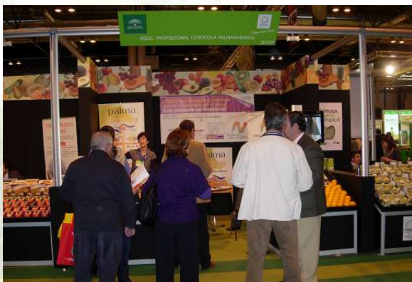
Vista del Stand en la Fruit Attraction

El Grupo de Desarrollo Rural del Medio Guadalquivir, un año más ha participado en el Encuentro de Formación y Empleo que organiza la Mancomunidad de Municipios de la Vega del Guadalquivir. Como en ediciones anteriores, el encuentro estuvo abierto al público durante dos días en horario de mañana y tarde en la Casa de la Cultura de La Victoria.