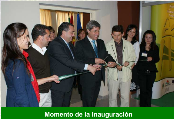
Momento de la Inauguración

La búsqueda de nuevos horizontes laborales para los más jóvenes, sobre todo en estos momentos tan complicados, es uno de los principales retos que se plantean desde el Grupo de Desarrollo Rural del Medio Guadalquivir, mediante el apoyo al desarrollo del empresariado, tanto a empresas ya constituidas como a emprendedores.