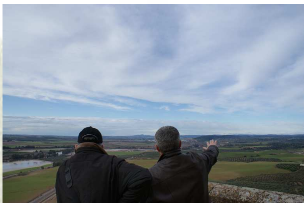
Contemplando el Valle del Guadalquivir

Durante los días de su visita, desde el GDR, le organizamos un Famtrip por el Valle del Guadalquivir, donde pudo comprobar in situ algunos de los productos turísticos que ya se encuentran en funcionamiento, así como algunas de las inversiones que se están realizando en materia turística en nuestro territorio, subvencionadas tanto por el Programa de Turismo Sostenible del Valle del Guadalquivir, como por el Grupo de Desarrollo Rural del Medio Guadalquivir.