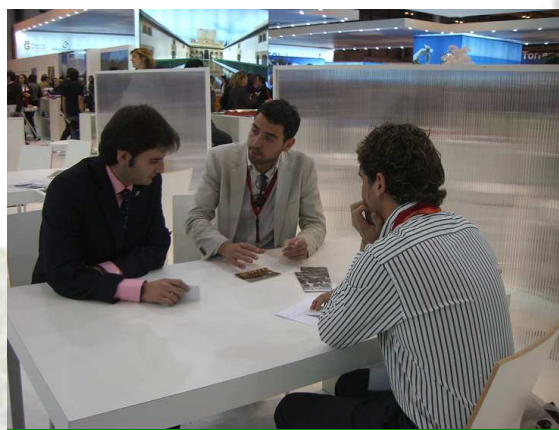
Reunión con empresarios turísticos

Durante los días de la Feria de Turismo, se ha ofrecido información de los empresarios del sector del Valle del Guadalquivir, gracias a la estrecha relación de colaboración existente entre los Centros de Iniciativas Turísticas y el Grupo de Desarrollo Rural del Medio Guadalquivir.