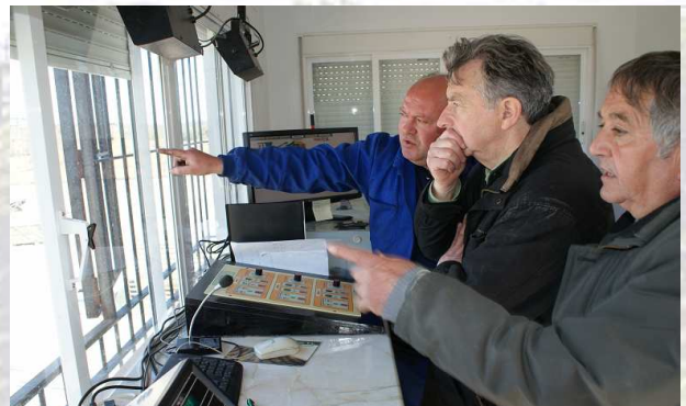
Momento de la Visita a la Almazara

Nos dirigimos a Bujalance, municipio eminentemente olivarero, a visitar una de sus almazaras, donde pudimos comprobar de primera mano cual es el proceso de elaboración del Aceite de Oliva, y de las posibilidades que suponen su producción.