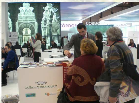
Atención al público en el stand del Valle del Guadalquivir

El Valle del Guadalquivir, ha mostrado todo su potencial en el Pabellón 3 del IFEMA, lugar donde se muestra toda la oferta turística de Andalucía. En el mostrador de este "nuevo espacio turístico, el Valle del Guadalquivir" se ha ofrecido a todos los visitantes y profesionales del sector, información de los productos turísticos que en la actualidad están funcionando en nuestra comarca, que son un claro ejemplo de la potencialidad de este territorio, y que nos permiten comprobar la diversidad de posibilidades económicas que este sector ofrece.