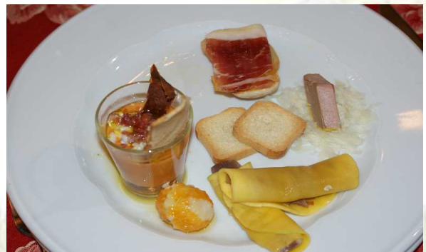
Uno de los platos degustados durante el Almuerzo

Finalmente, le mostramos la rica gastronomía del Valle del Guadalquivir, gracias al buen hacer de nuestros restauradores y a la calidad de los productos que se cultivan a las orillas de nuestro gran río. En Cañete de las Torres, pudo degustar algunos platos, confirmando así el gran potencial turístico de nuestra comarca.