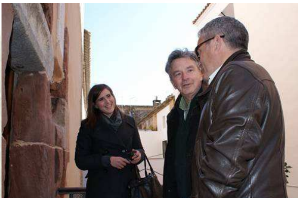
Visita a la Torre de Garci Méndez de El Carpio