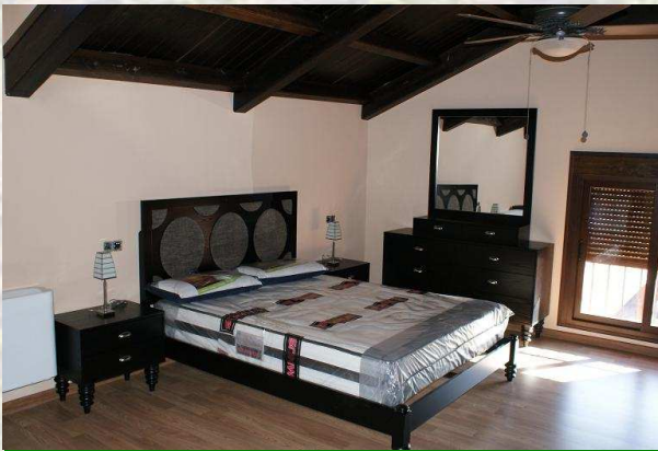
Habitación Casa Rural La Huertezuela

Nuestro recorrido por el Valle del Guadalquivir continuó en Villafranca de Córdoba, visitando uno de los nuevos alojamientos rurales con los que vamos a contar en unos meses, las casas rurales de la Finca la Huertezuela, financiadas por el Programa de Turismo Sostenible del "Valle del Guadalquivir, Un nuevo espacio turístico". Este complejo va a contar con varias casas, con capacidades desde 2 a 8 personas, y con una serie de actividades complementarias, que crearán una importante y atractiva oferta de servicios.