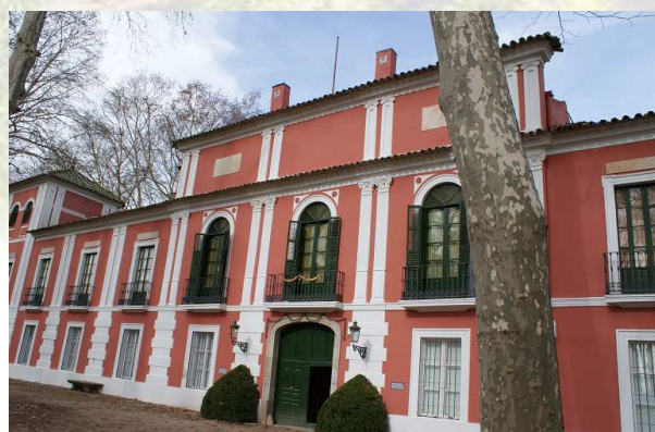
Fachada principal del Palacio

Este lugar que en pocos meses será un Hotel de 5 estrellas, se va a convertir en uno de los mejores servicios de alojamiento y restauración del Valle del Guadalquivir, generando de esta manera unas infraestructuras de calidad, en un entorno inimitable.